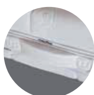
DOREZA SOFT CARE