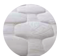
PELHURA SOFT CARE

Ky dyshek mund te perdoret per peshat e medha.